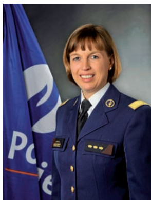
Catherine De Bolle Commissaris-generaal